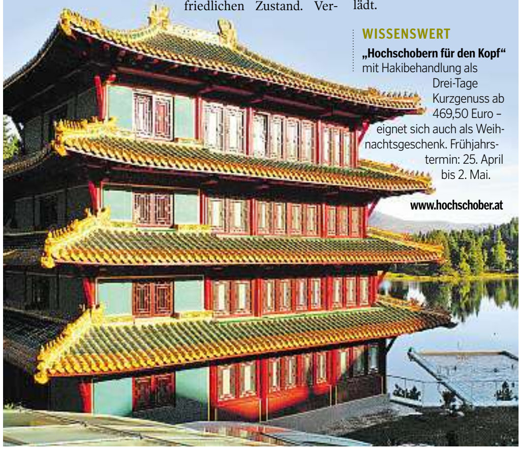
Exotisches Flair an der Grenze zwischen Kärnten und der Steiermark: die Anlage Hochschober