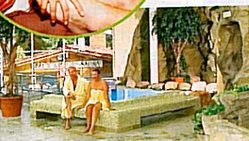
Ruheoase 2.500 qm Saunabereich mit Außenbecken und Kuschecken